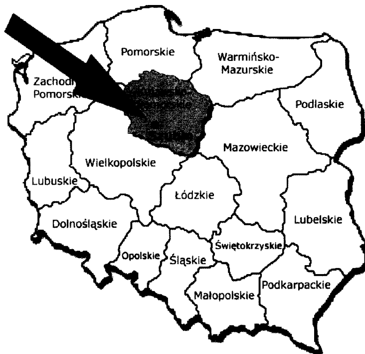
Sytuowanie Szubina w skali kraju.