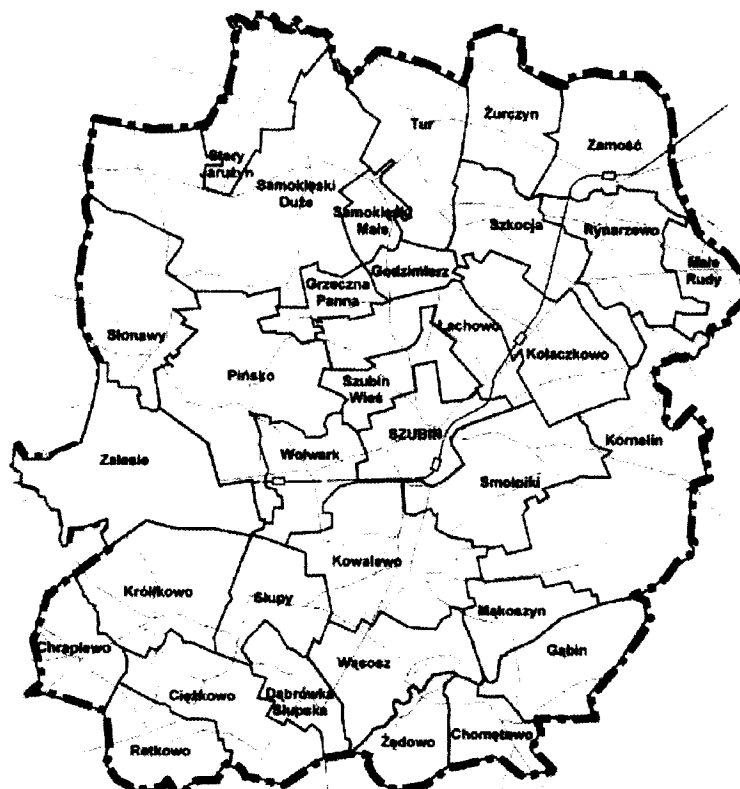
Podział administracyjny gminy Szubin