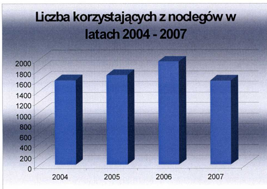
Wykres 2. Liczba osób korzystających z noclegów w Szubinie w latach 2004 - 2007