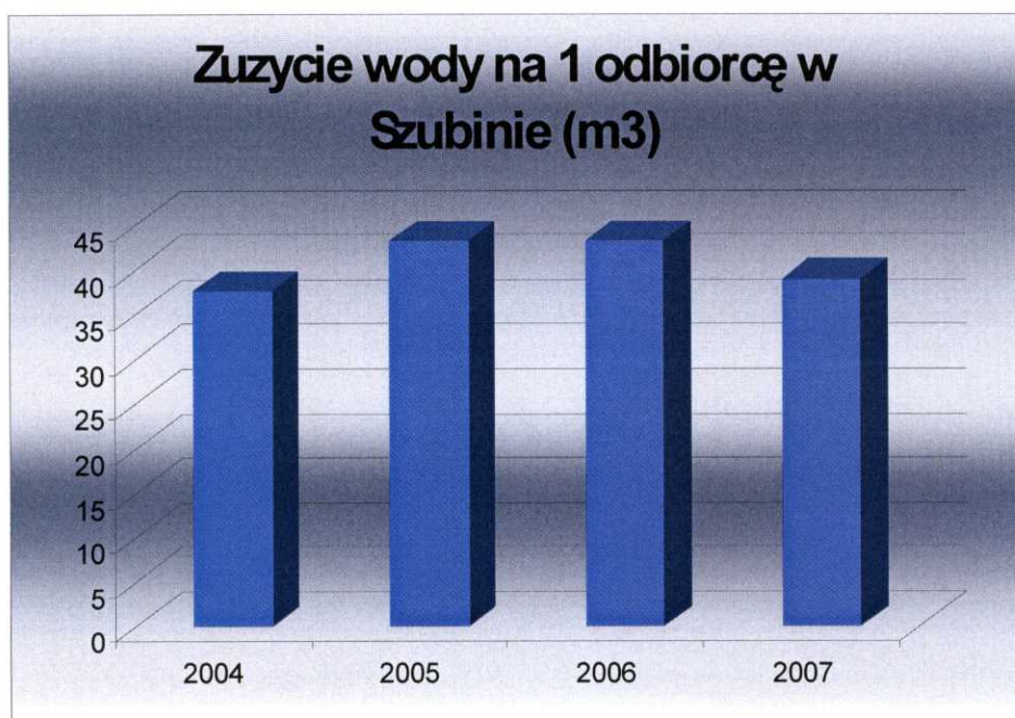
Wykres 3. Zużycie wody