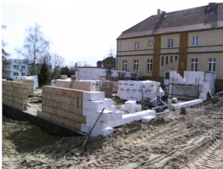
Fot. Rozbudowa szkoły

Oprócz przyszkolnego boiska, placu zabaw oraz parku o powierzchni 3,14 ha, w którym znajduje się letni amfiteatr, staw oraz ławki, we wsi nie ma innych ogólnodostępnych terenów zielonych i rekreacyjnych. Od marca 2010 roku trwają prace związane z rozbudową szkoły o salę gimnastyczną z częścią dydaktyczną i socjalną. Tym samym poprawi się baza sportowo – rekreacyjna Królikowa, z której korzystać będą dzieci, młodzież oraz dorośli mieszkańcy.