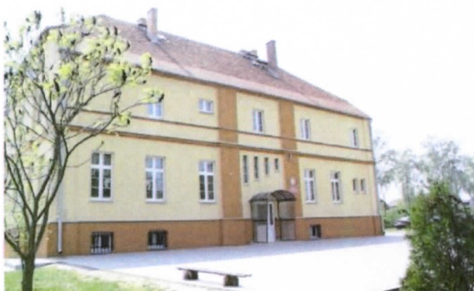
Fot. Dawny dwór Rogalińskich - obecnie szkoła podstawowa