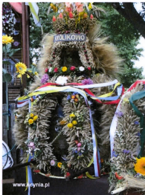
Fot. Nagrodzony wieniec dożynkowy

z powodów zarobkowych. Na terenie wsi działa Rada Sołecka, Miejsce Koło Gospodyń Wiejskich oraz Ochotnicza Straż Pożarna. Aktywność społeczna mieszkańców widoczna jest nie tylko na szczeblu lokalnym, ale także powiatowym i regionalnym. Między innymi w 2005 roku Sołectwo Królikowo było gospodarzem gminnych Dożynek, a w 2008 roku jednym z organizatorów i gospodarzem dożynek powiatowo – gminnych. Przygotowany przez KGW wieniec dożynkowy zajął wówczas pierwsze miejsce. KGW Królikowo otrzymało również nagrodę za zajęcie trzeciego miejsca na najciekawsze stoisko.