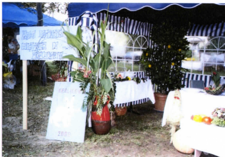
Fot. Stoisko dożynkowe KGW Królikowo