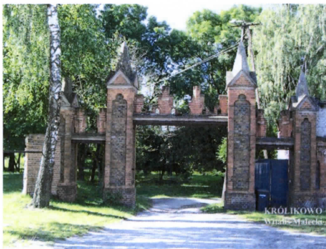
Fot. neogotycka brama