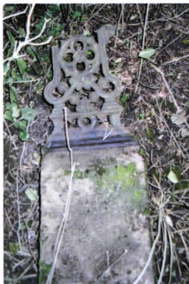
Fot. Nagrobek ewangelicki