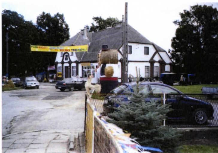
Fot. Budynek dawnego pensjonatu