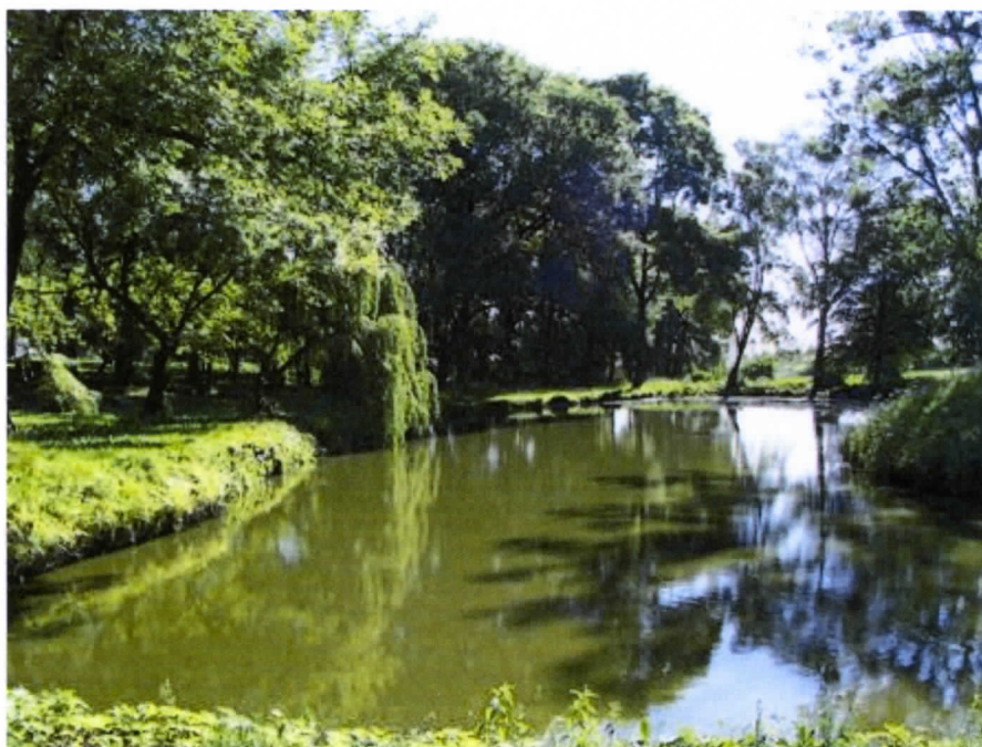
Fot. Park z widokiem na staw

Jest wsią czystą, przestrzenną. Uroku dodają jej zachowane przez wieki tradycje i XIX wieczne budynki mieszkaniowe i gospodarskie, których ściany zbudowane są z cegły formowanej o motywie gotyckim i podmurówce z głazów granitowych. Wieś posiada raczej zwartą zabudowę zagrodową, przedzieloną ulicami, 4 drogami powiatowymi oraz drogami gminnymi, łączącymi Królikowo z sąsiadującymi miejscowościami, drogą wojewódzką Nr 247 oraz drogą krajową Nr 5. W centralnej części miejscowości znajduje się XIX wieczny dwór – budynek szkoły podstawowej i park.