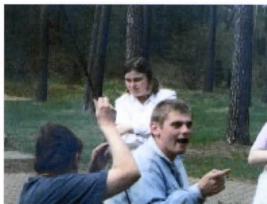
Fot. Zajęcia rozwojowo – rekreacyjne w plenerze