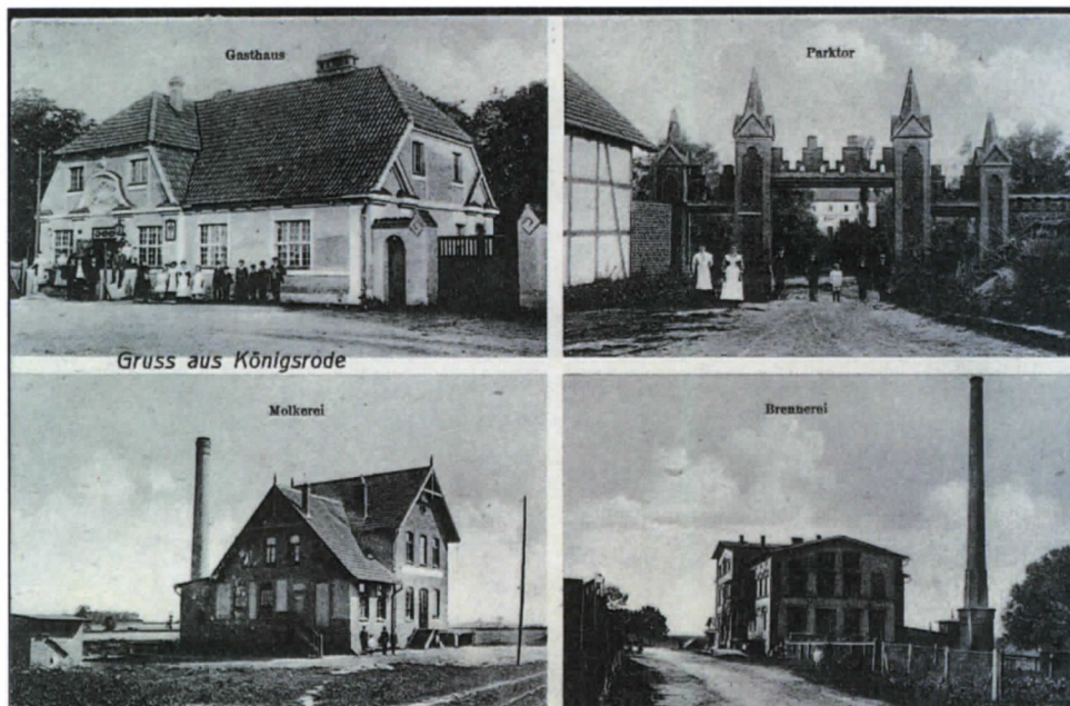
Fot. Pocztówki z XIX wieku (pensjonat, brama wjazdowa do parku, młyn, gorzelnia)